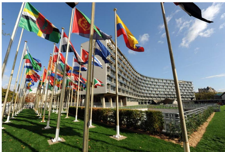
Штаб-квартира ЮНЕСКО в Париже

Штаб-квартира ЮНЕСКО располагается в столице Франции – г. Париже. Организация имеет также более 50 местных представительств по всему миру.