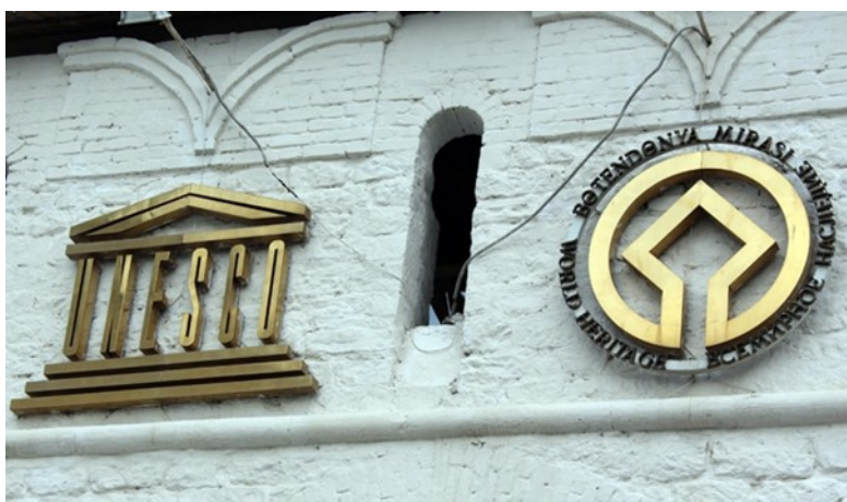
Эмблема Всемирного наследия на стене Казанского Кремля

Эмблема, являясь символом Конвенции, выражает приверженность государств-сторон ее принципам и служит для обозначения объектов, включенных в Список всемирного наследия.