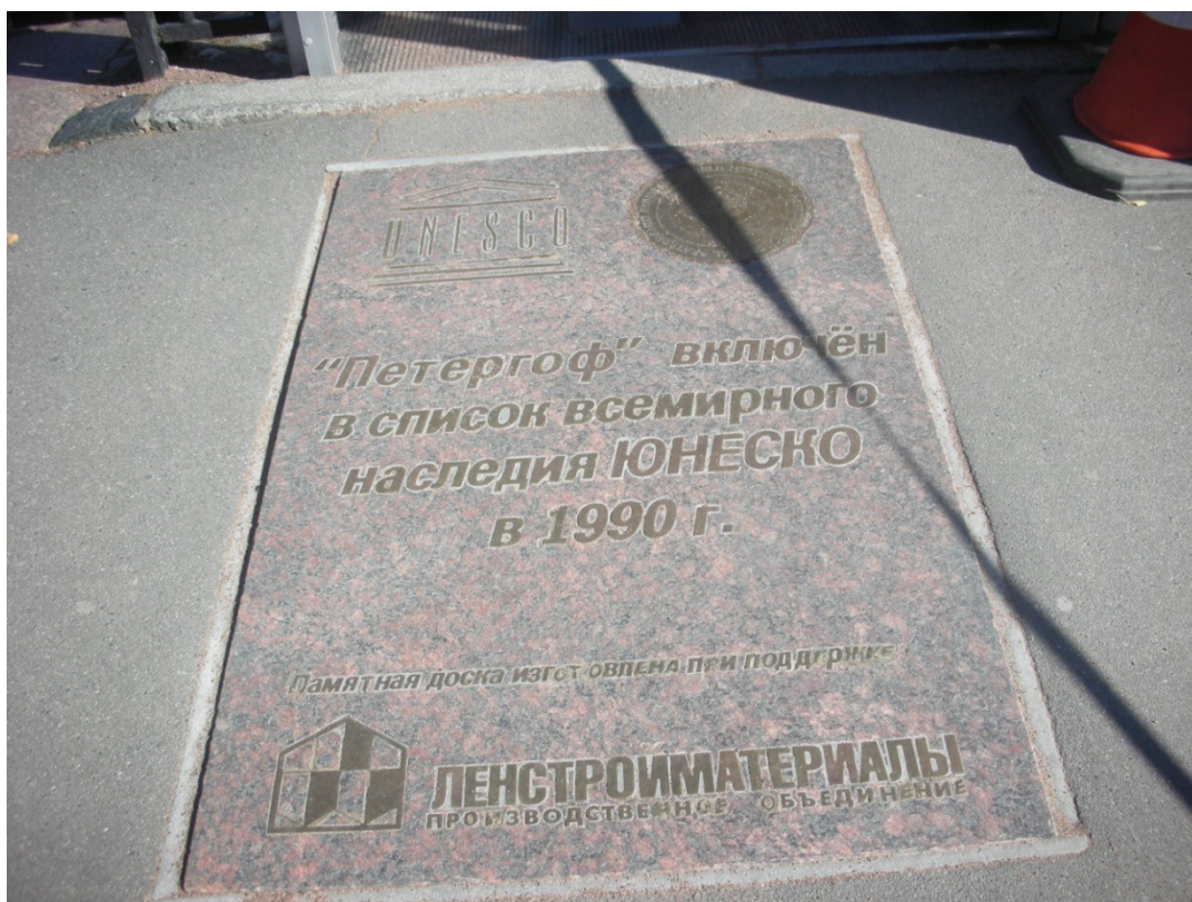
Ранее установленная памятная табличка в Петергофе