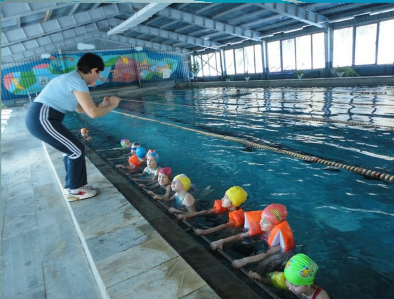
Занятия в бассейне